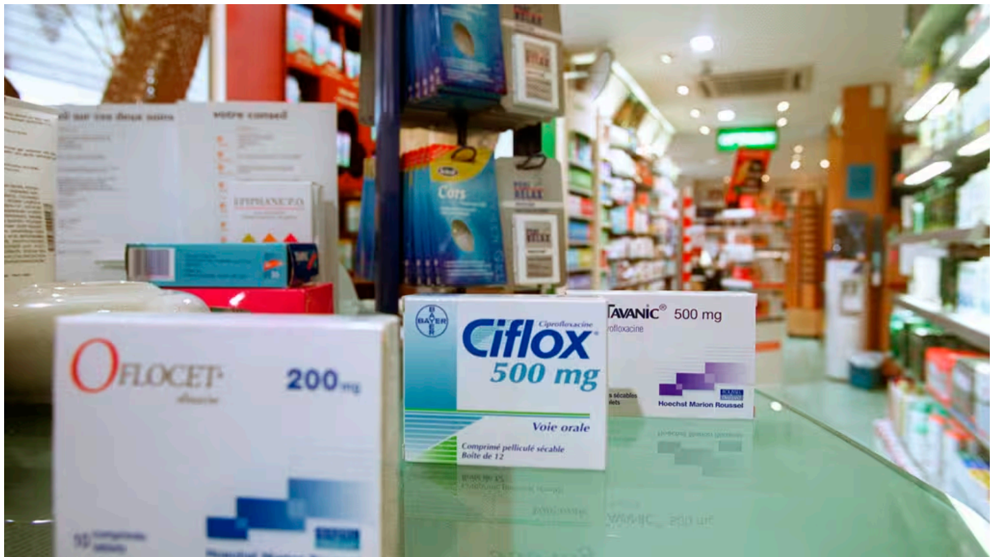
Des fluoroquinolones commercialisés sous les marques Ciflox, Oflozet et Tavanic (photo d'illustration).

Ils s'appellent Ciflox, Uniflox, Tavanic ou Oflozet. Ces antibiotiques, de la famille fluoroquinolones, sont encore très - trop - souvent prescrits en France pour des infections simples comme des cystites, des rhinites ou encore des diarrhées. C'est ce qui ressort de deux expertises dévoilées, jeudi 20 février, par l'Agence française du médicament (ANSM), qui confirme la grande toxicité de ces antibiotiques "très efficaces" mais aux "effets indésirables rares mais graves, invalidants, persistants et potentiellement irréversibles touchant notamment les muscles, les articulations et le système nerveux".